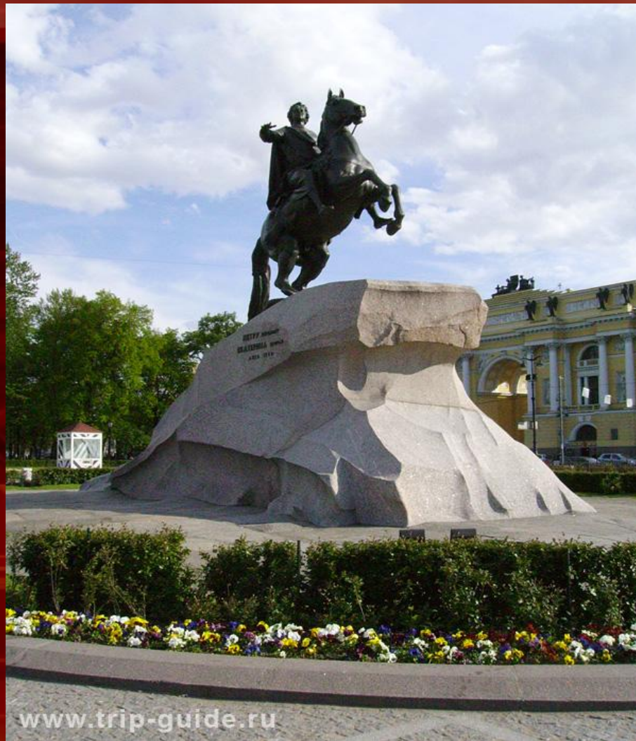
Памятник основателю города Петру I « Медный всадник »