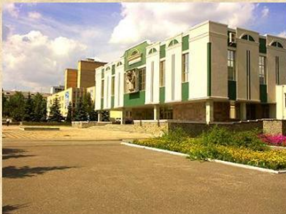
Музей имени С.Д.Эрзы