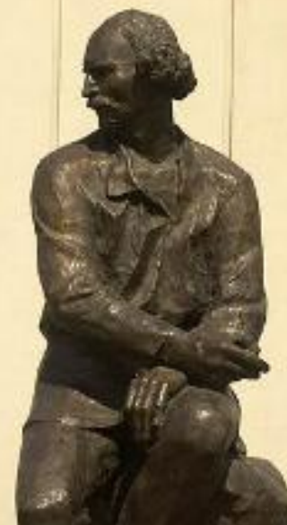
Открыт 26 июня 1956 года.