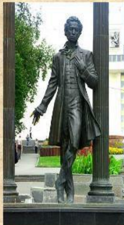
Памятник А.С.Пушкину открыт в 1977году.