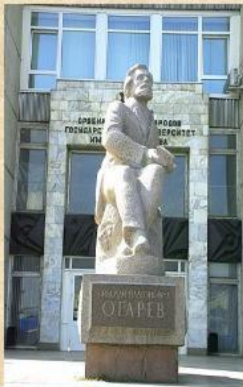
Памятник Н.П.Огарёву открыт 6 декабря 1984 года.