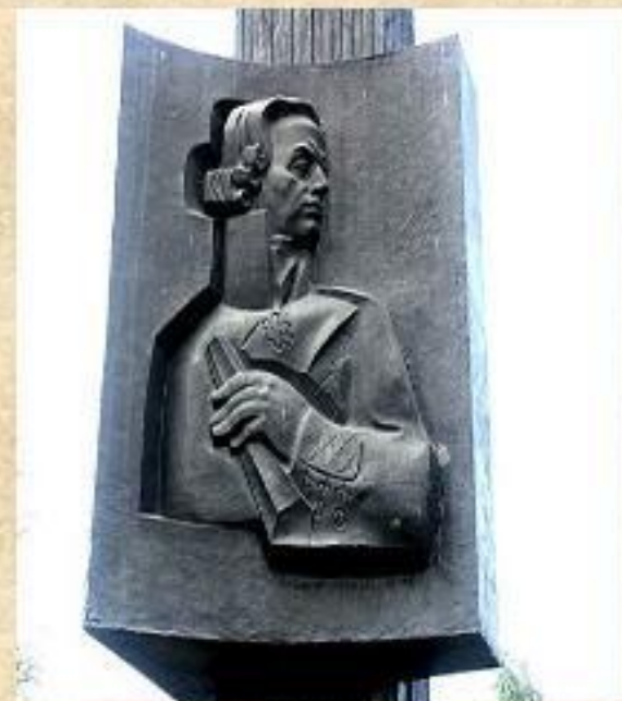
Памятник Ф.Ф.Ушакову открыт 10 августа 2006 года.