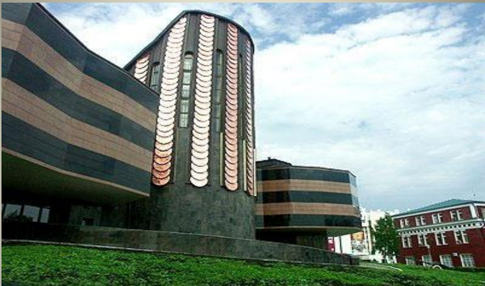
Музей боевого и трудового подвига 1941-1945 гг