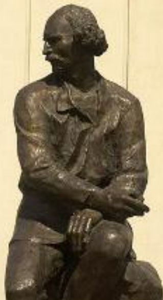
Открыт 26 июня 1956 года.