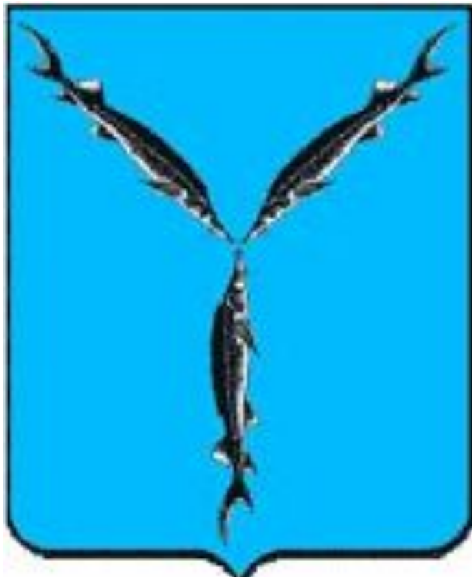
Герб муниципального образования "Город Саратов"