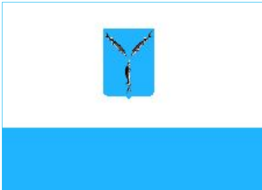
Флаг муниципального образования "Город Саратов"