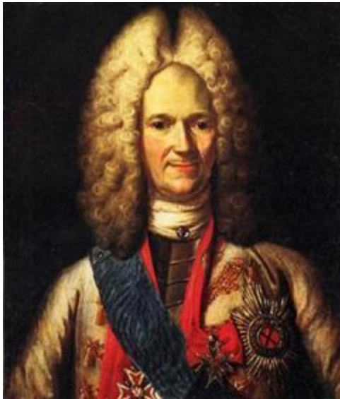
Светлейший князь А.Д. Меншиков

С тех пор прошло не мало лет. Царей давным-давно уж нет. Исчезли графы и князья. А Русь по-прежнему жива.