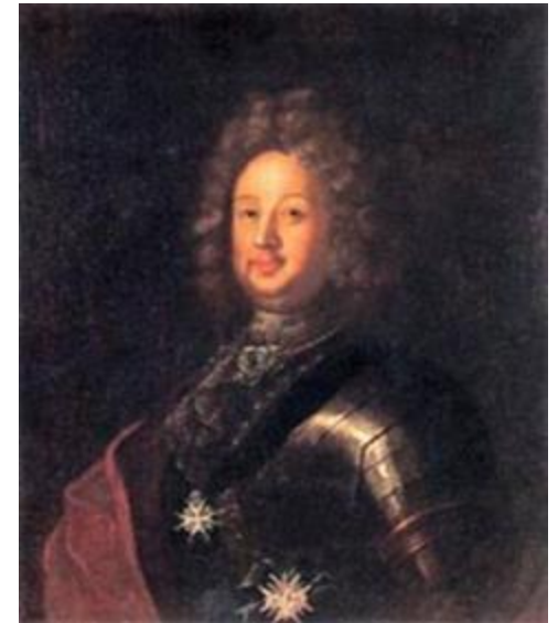
Граф Б.П. Шереметев