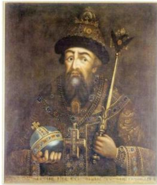
Царь Иоанн IV Грозный