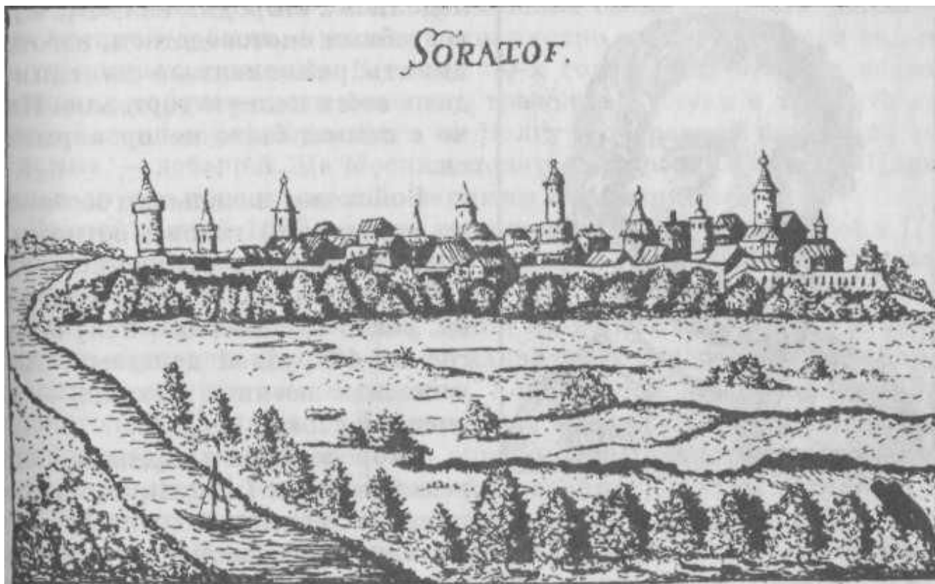
Саратов левобережный. С рисунка худ. А. Оlearия. 1636 г.

И скромным именем Саратов его не веки нарекли.