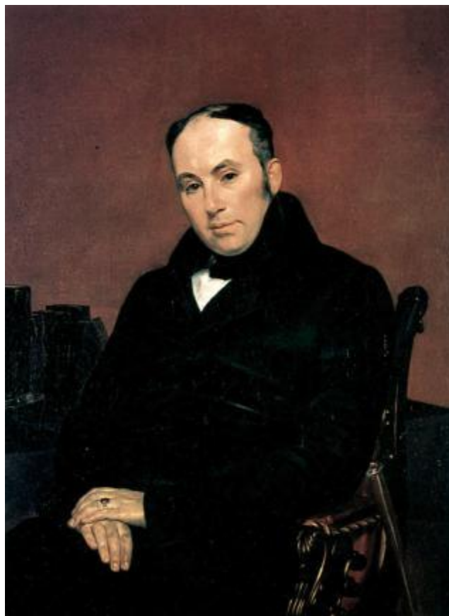
Жуковский Василий Андреевич