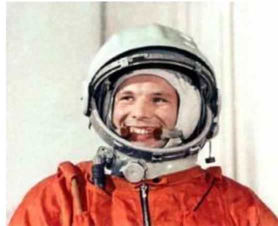
Гагарин Юрий Алексеевич