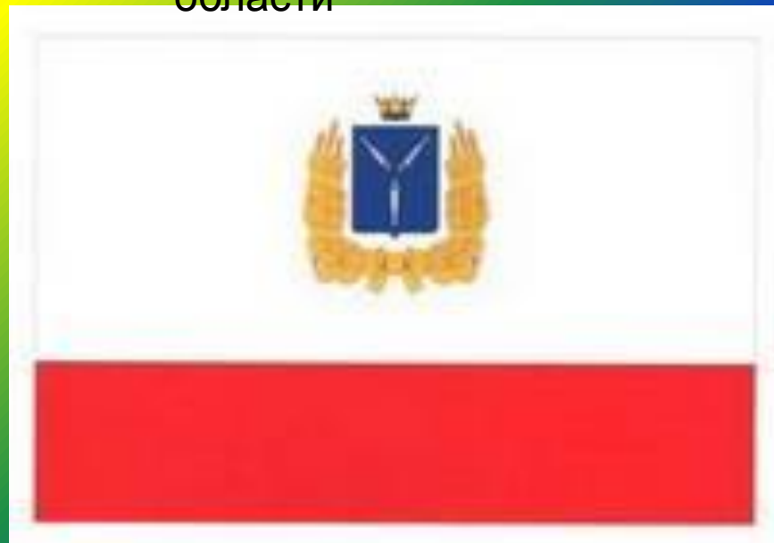
Флаг Саратовской области