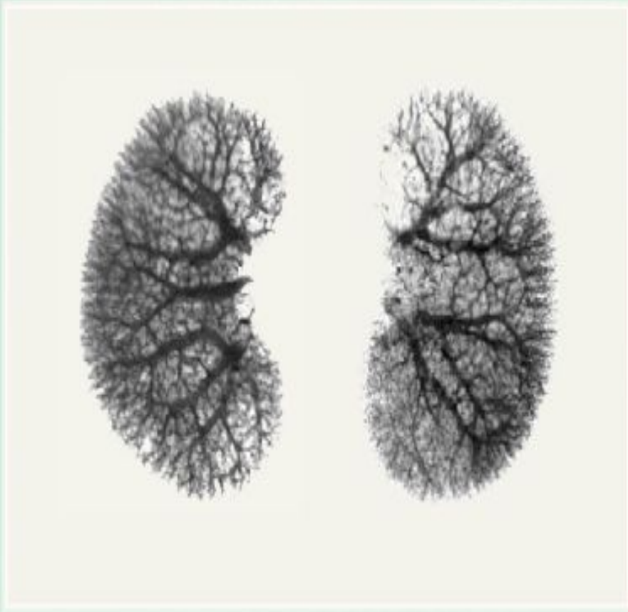
Кровеносные сосуды почек (ангиограмма правой и левой почки).

Почки поддерживают постоянство объема и состава межклеточной жидкости. Они выводят из организма излишки воды и растворенных в ней веществ, тем самым создавая оптимальные условия жизнедеятельности клеток. При недостатке воды или солей начинают действовать процессы, уменьшающие дальнейшую потерю именно этих веществ, причем скорость вывода вредных для организма продуктов обмена веществ остается неизменной.