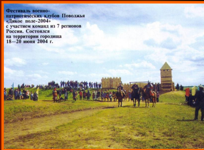
Фестиваль военно- патриотических клубов Поволжья «Дикое поле-2004» с участием команд из 7 регионов России. Состоялся на территории городища 18–20 июня 2004 г.

Первые его описания составили С.Е. Мельников (1856), С.М. Шпилевский (1877), И.Я. Зайцев (1892). В 1948 раскопки произведены А.П. Смирновым и В.Д. Димитриевым, в 1957 – Г.А. Федоровым-Давыдовым.