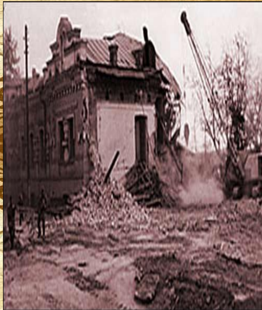
Снос Дома Ипатьева