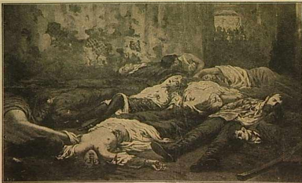
ЕКАТЕРИНБУРГСКОЕ ЗЛОДѢЯНИЕ. — 17 июля 1918 г.

Военные власти Белой армии образовали следственную комиссию, которая произвела осмотр шахты заброшенного рудника вблизи деревни Костяки.