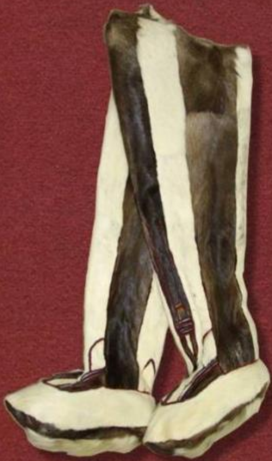
Пимы (мужские) – зимняя обувь оленеводов. Ижемский район, Коми АССР. 1950-е гг. Олений камус, сукно, пошив.