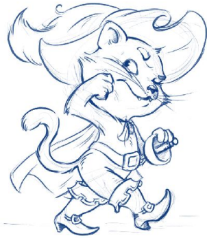
Кот в сапогах