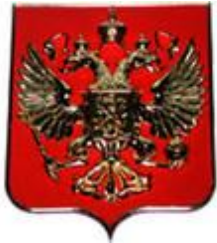
Рисунок орла на гербе исходит из эпохи правления Петра I. Это один из древних символов борьбы добра над злом, света с тьмой, защиты Отечества.