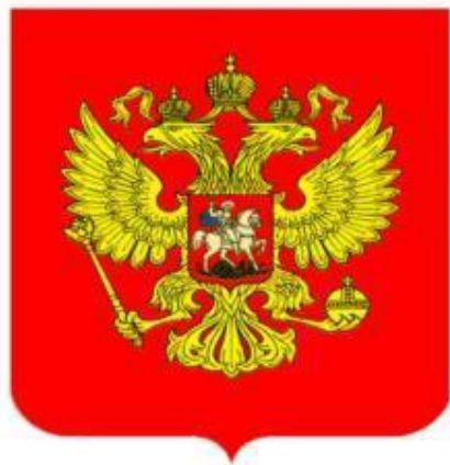
Герб Российской Федерации

Посредством чтения художественной литературы, рассматривания картин дети знакомятся с Москвой – столицей России, Краснодаром – столицей Краснодарского края, городом Анапа и различными символами разных национальностей.