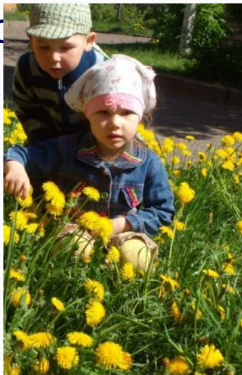
Экскурсия на берег реки Волги