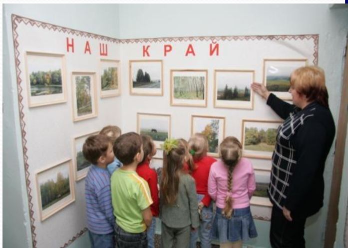
Экскурсия к стенду «Наш край»