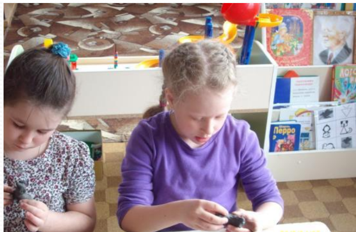
Мастер – класс по изготовлению жбанниковской свистульки