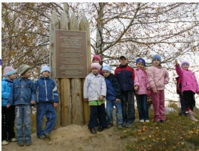
Экскурсия на Городецкий Вал