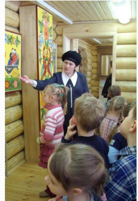
Рассматривание Городецкой росписи