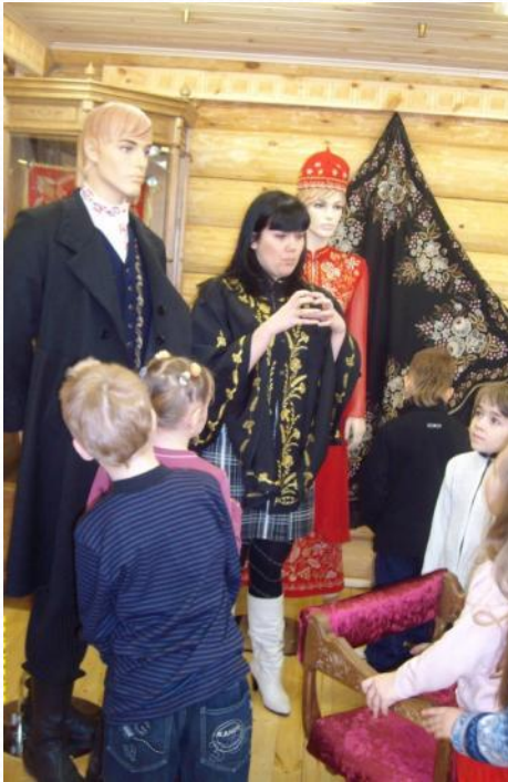
Знакомство с ЗОЛОТОЙ ВЫШИВКОЙ