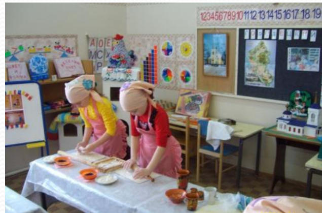
НОД на тему: «Изготовление Городецкого пряника»