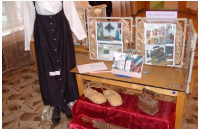
Знакомство с одеждой и обувью наших предков