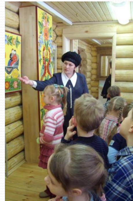
Рассматривание Городецкой росписи