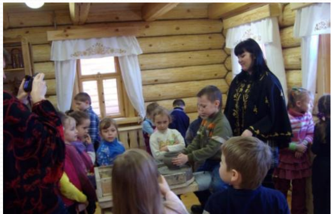
Мастер – класс по изготовлению глиняной