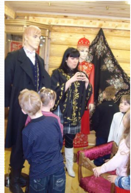
Знакомство с декором одежды