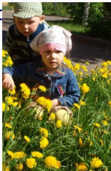
Экскурсия на берег реки Волги