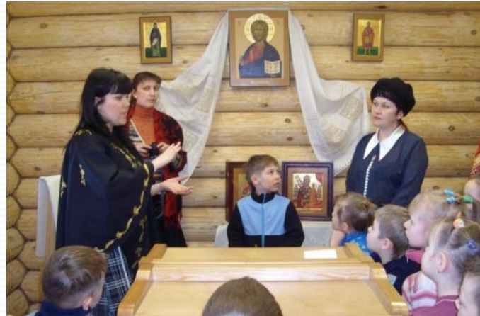
Знакомство с иконописью