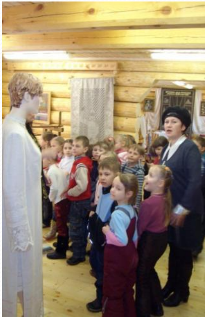
Знакомство с народным костюмом