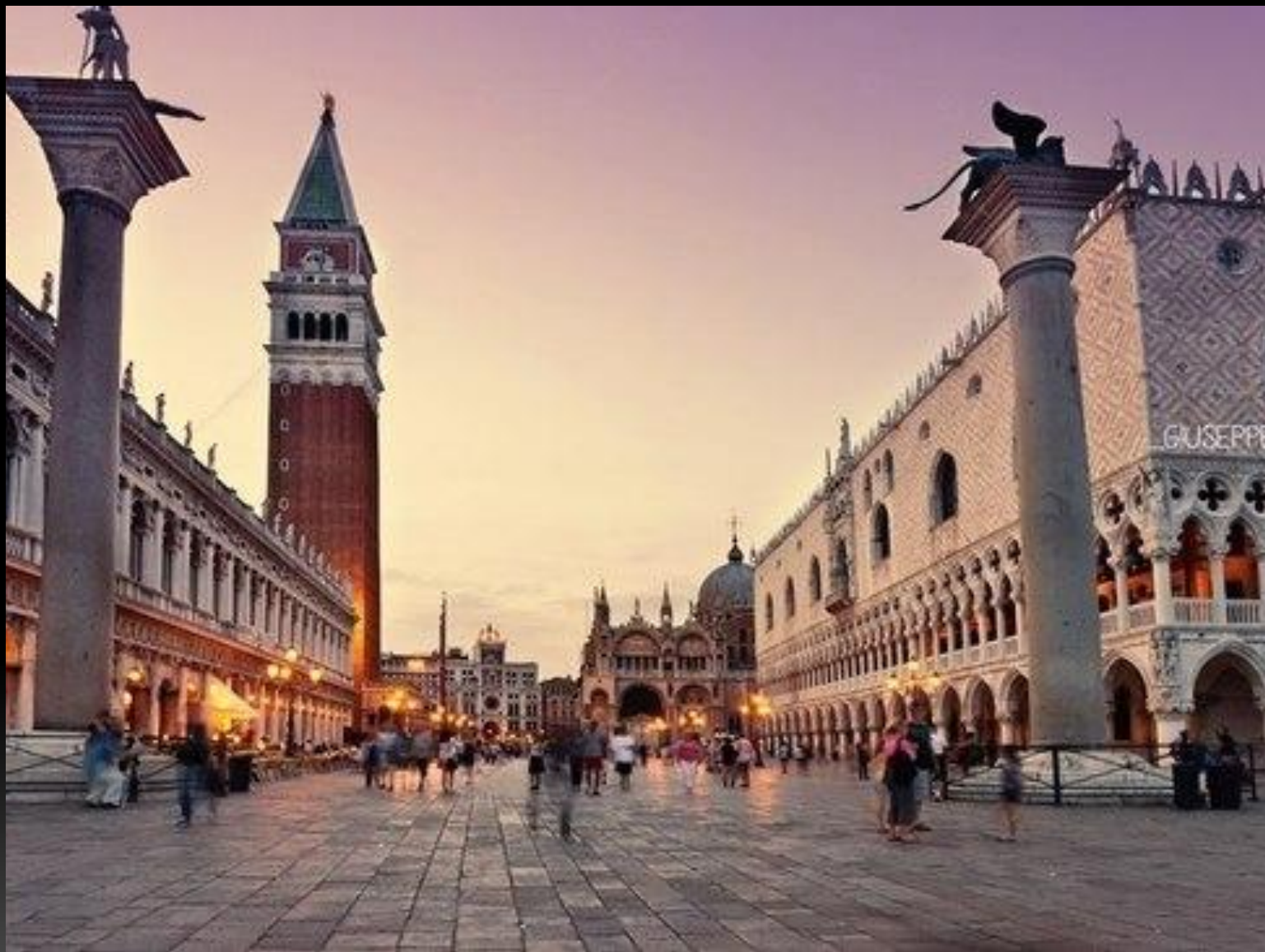
Площадь Сан-Марко-душа и сердце Венеции