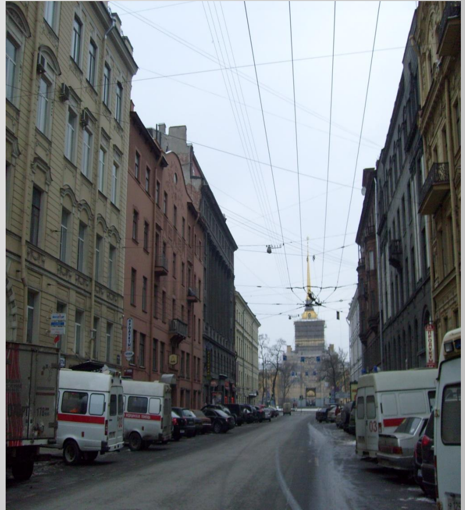
Вид на Адмиралтейство с Гороховой улицы