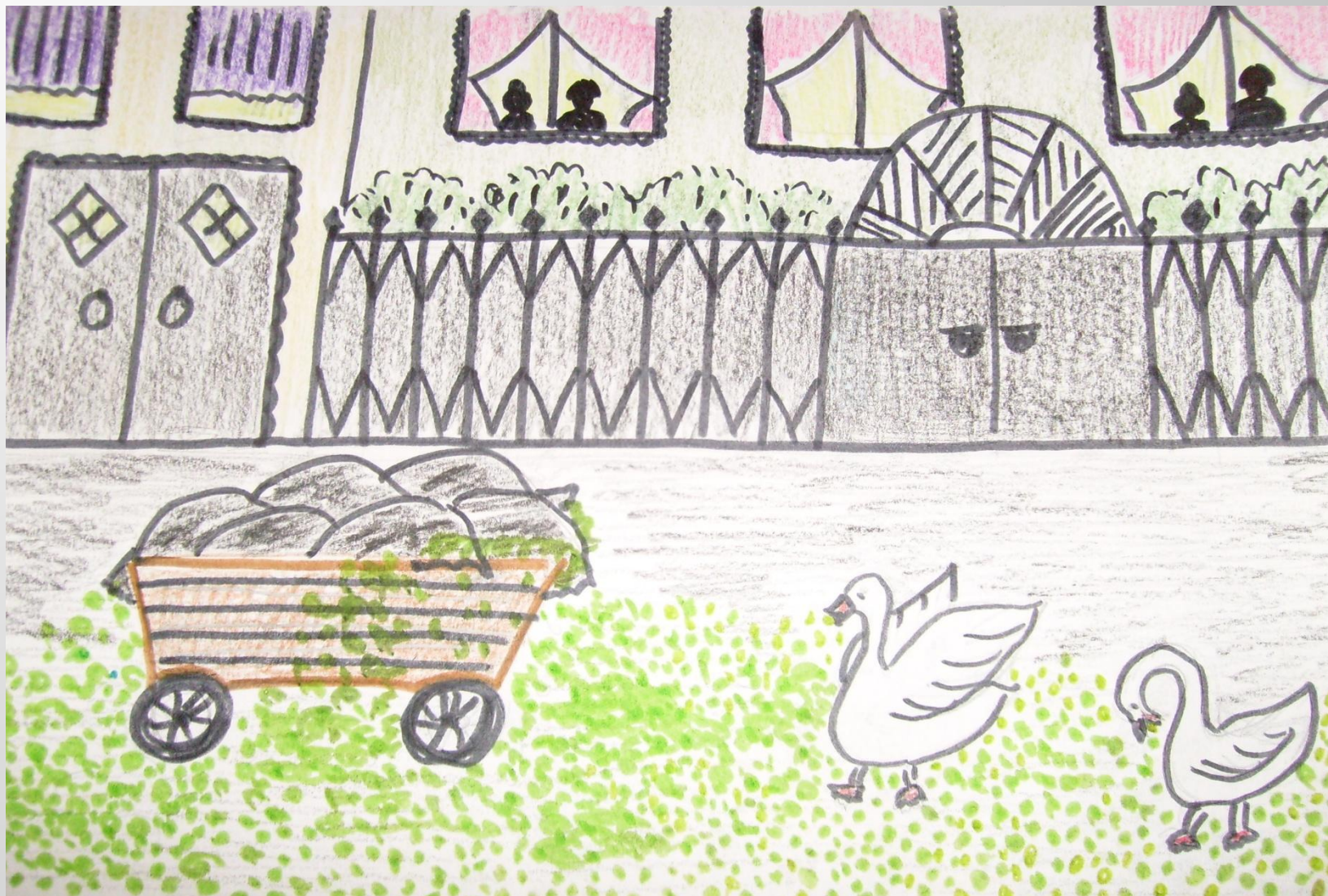
Иллюстрация к сказке