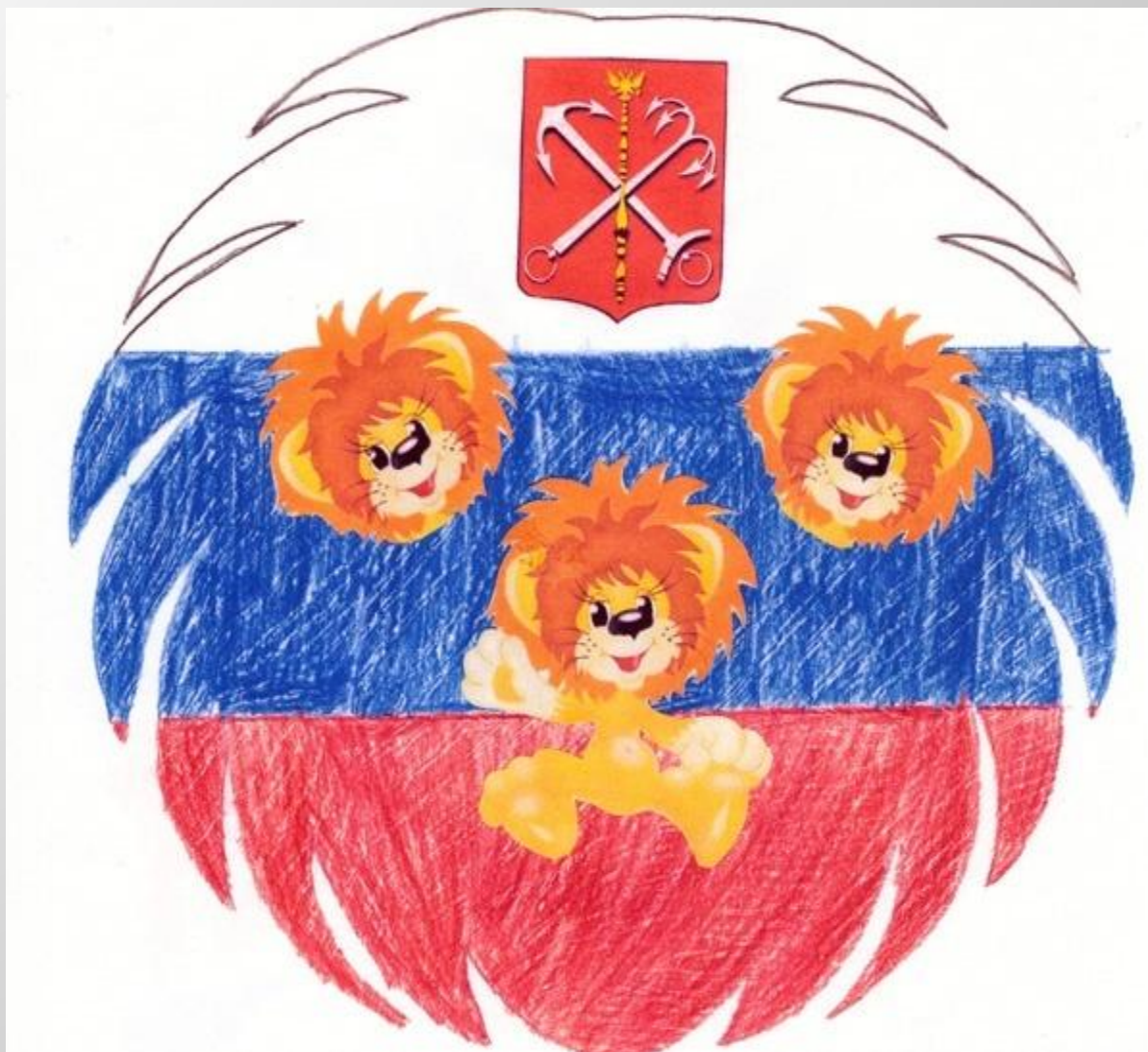
Рисунок – коллаж Ольги Б., 3-А класс