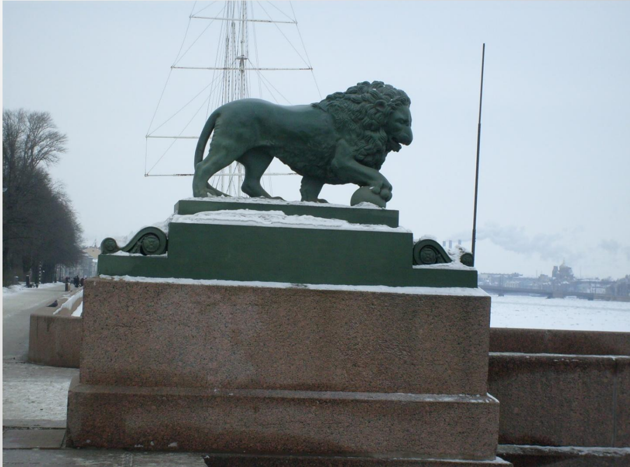
Львы у Дворцовой пристани