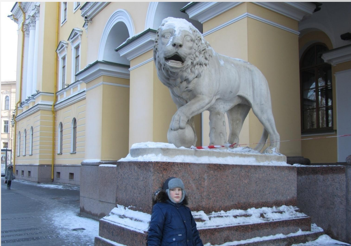
Мраморные львы на Адмиралтейском проспекте у дома Лобанова-Ростовского