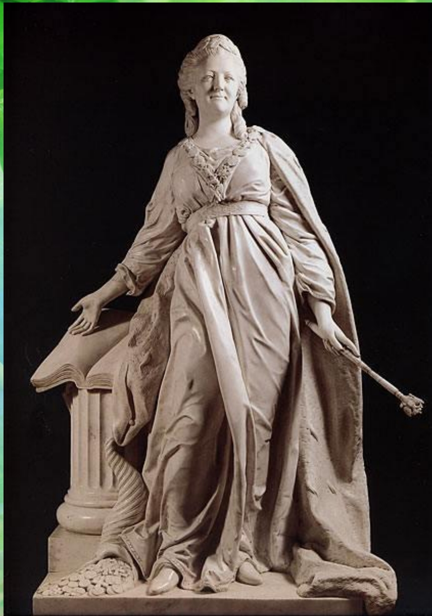
Катерина II – законодательница. 1789 г. Скульптор Ф.И. Шубин.