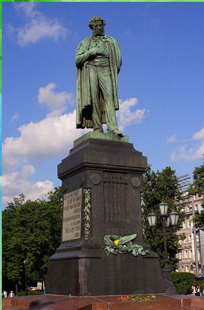
Памятник А.С. Пушкину. Москва. Скульптор А.М. Опokuшин. Установлен в 1880 г.