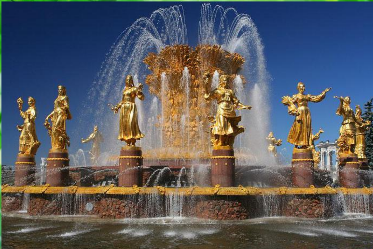
Фонтан «Дружба народов СССР»