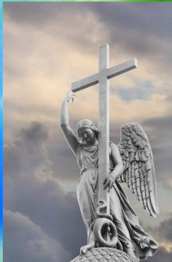
Ангел, венчающий Александрийскую колонну. Петербург. Б.И. Орловский