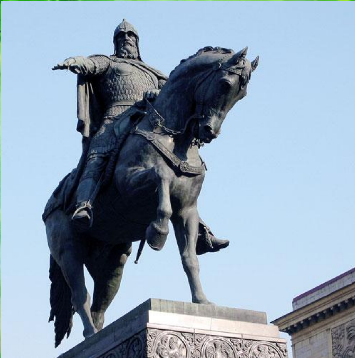
Памятник Юрию Долгорукому, Москва. Установлен в 1954 г. Скульптор С. М. Орлов.