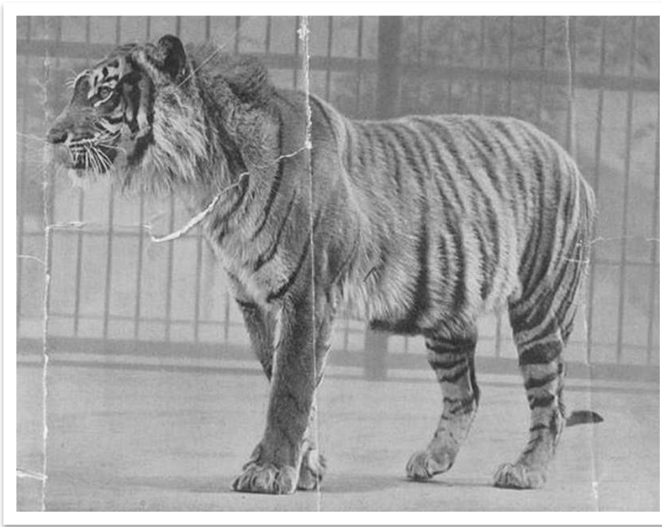
Тигр острова Ява