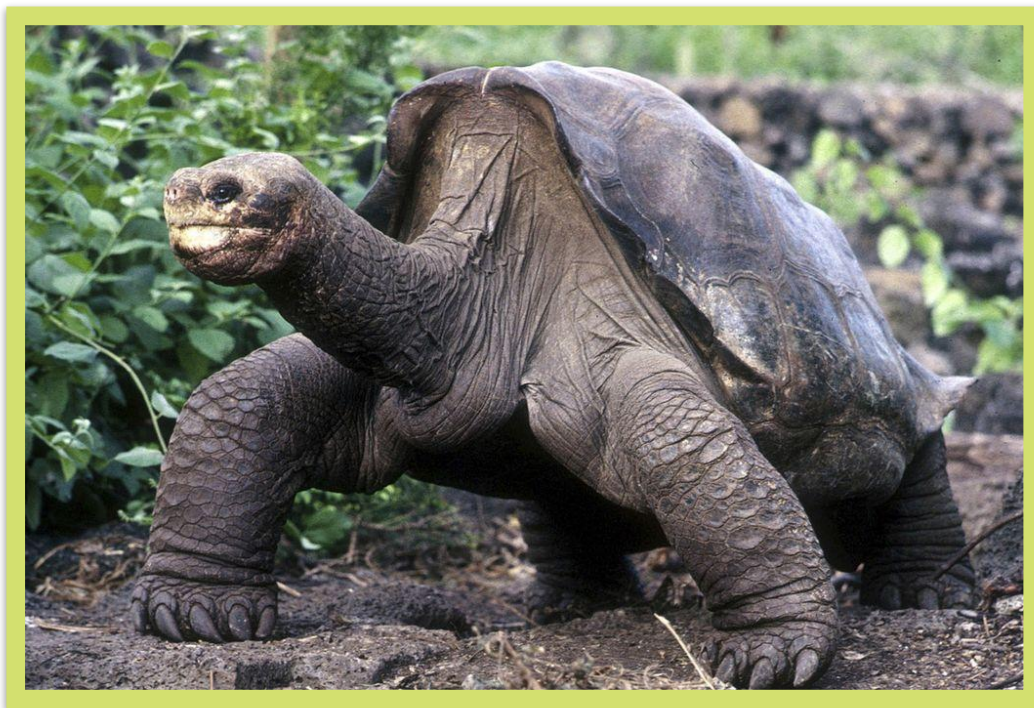
Пинт арыы черепахата