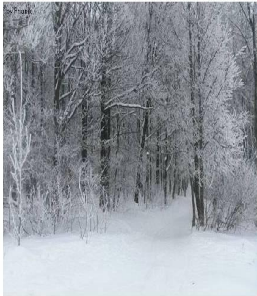
Смешанные и широколиственные леса зимой