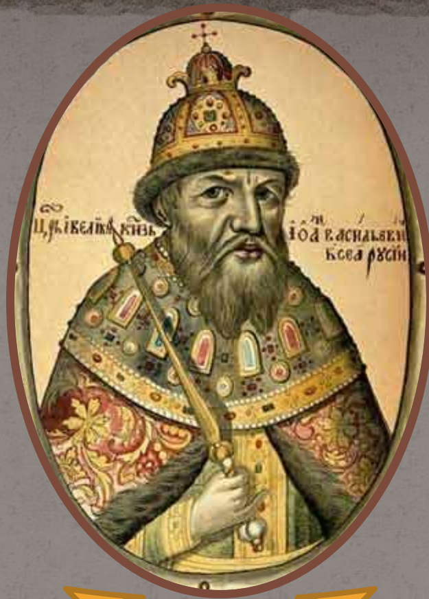
Иоанн Васильевич Грозный