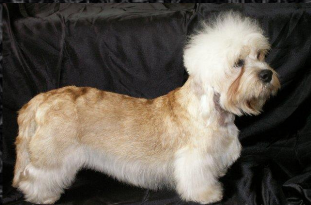
денди – димонд – терьер