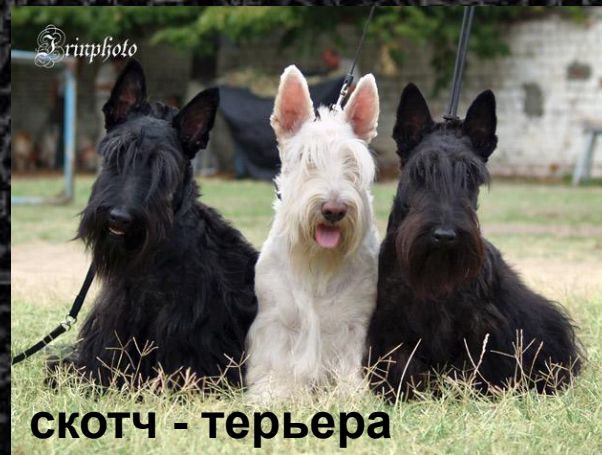
скотч - терьера