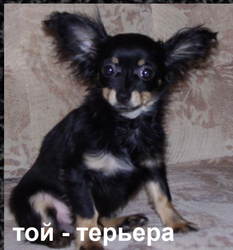
той - терьера