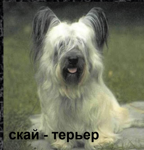
скай - терьер