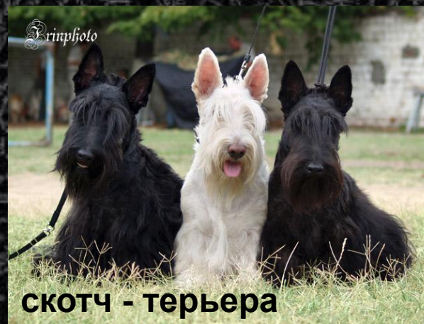
скотч - терьера