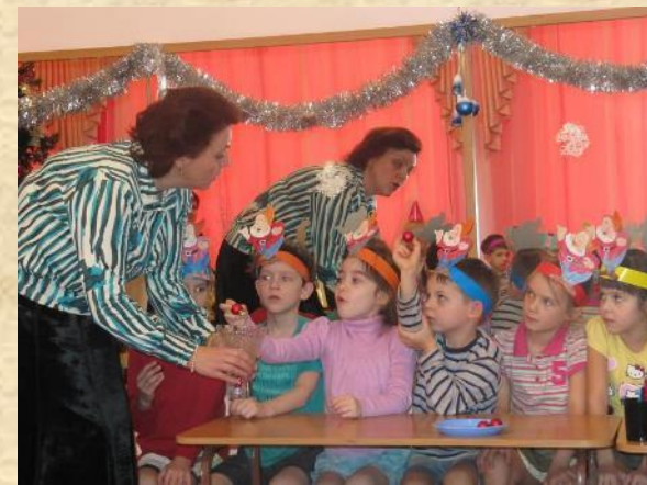
Новогодний ринг «Дорогами добра»