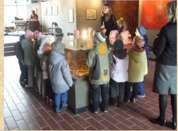
В Ивановской башне Кремля