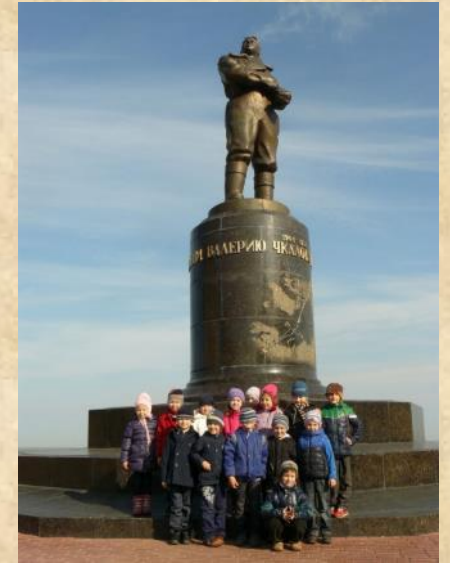
По улицам родного города