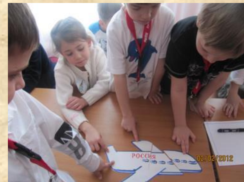
Игра-викторина «Мой Нижний Новгород»