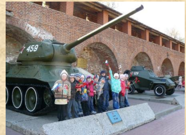
В Нижегородский кремль