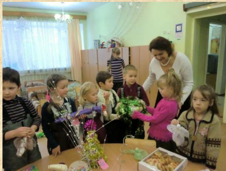
Новогодние и рождественские подарки для детей из приюта