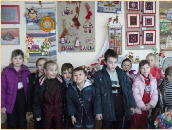
В музее Н.А.Добролюбова