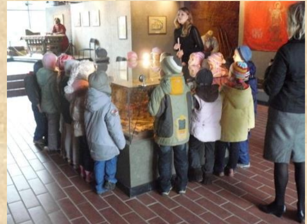
В Ивановской башне Кремля