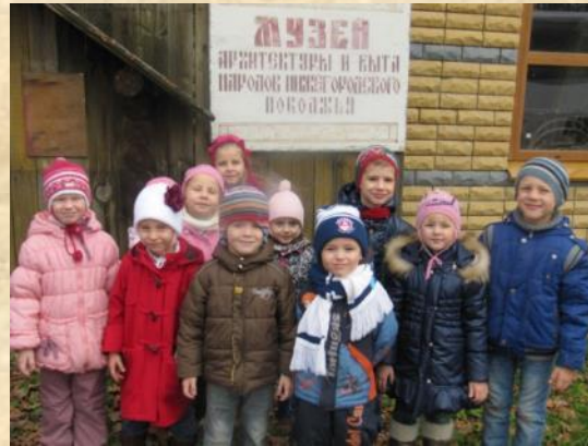
На Щелковском хуторе