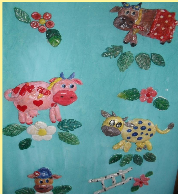
Работы из солёного теста Оформление фойе гимназии, 3 этаж