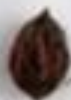
С. 16 САРАМАНДА