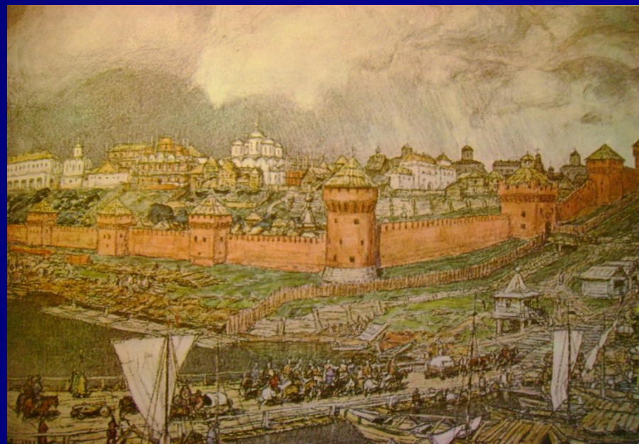
«Московский Кремль при Дмитрие Донском» «Московский Кремль при Иване III»