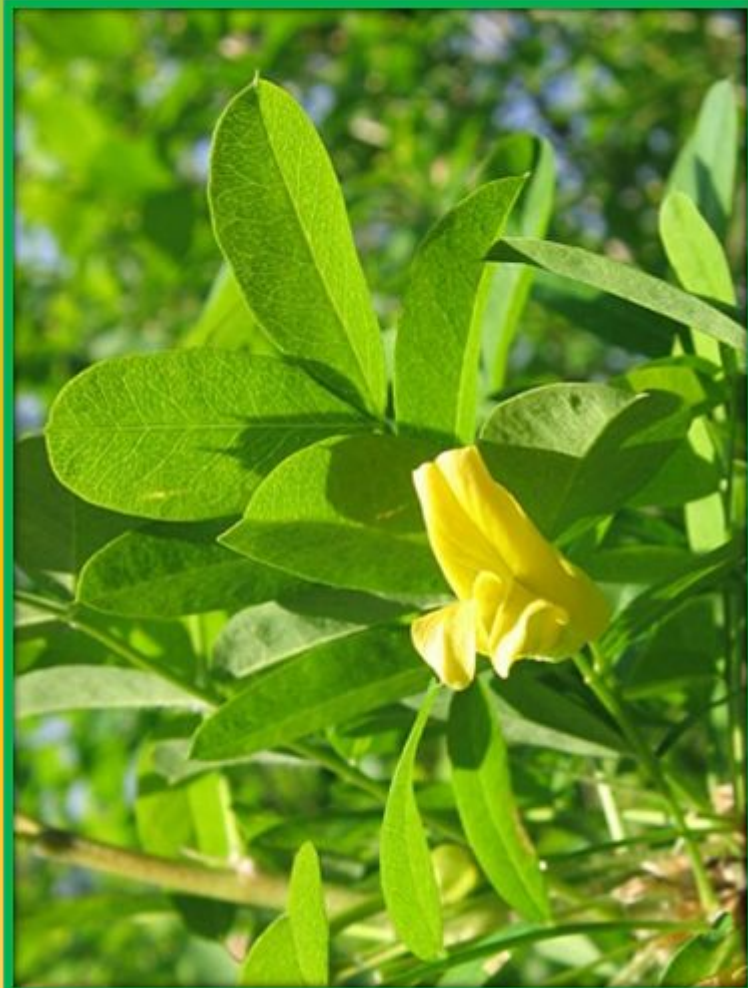
жабрица жёлтая акация