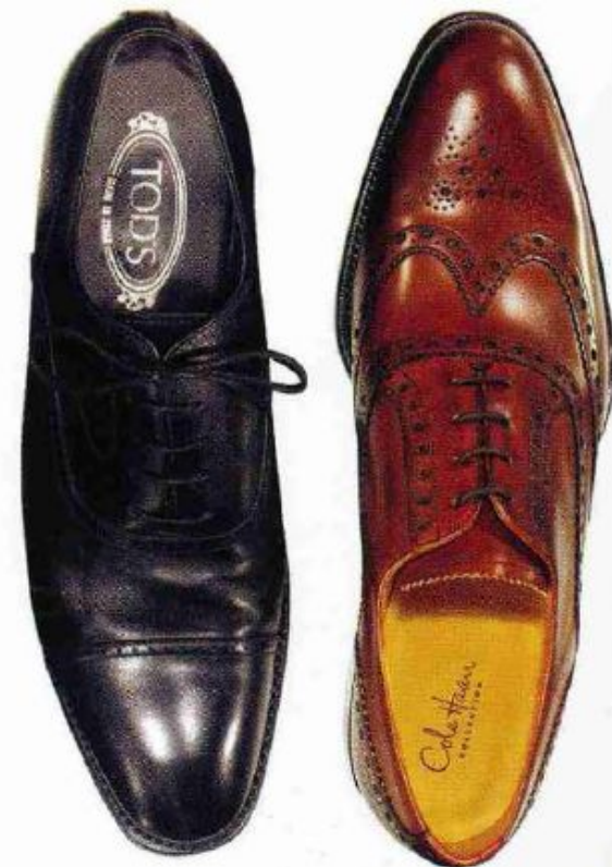
Две пары обуви: Черного и темно-коричневого цвета