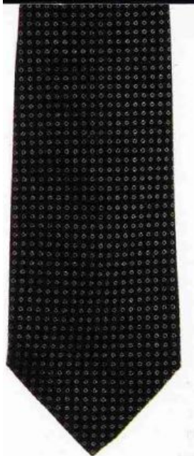
Темный узкий галстук