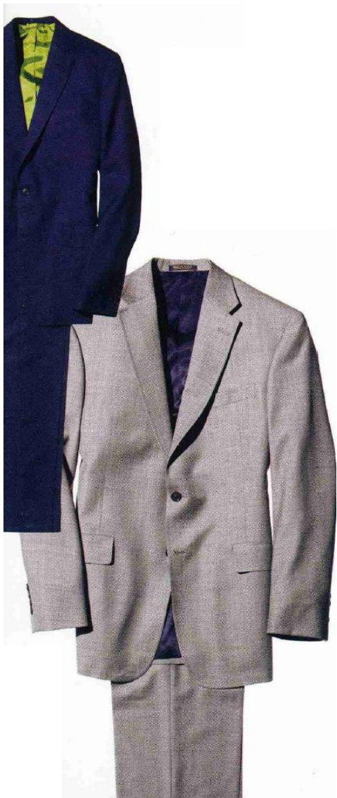
Однобортные костюмы серого и темно-синего цветов