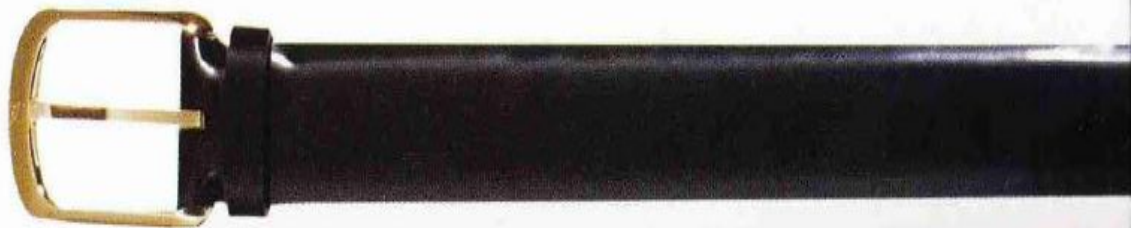
Простой черный ремень