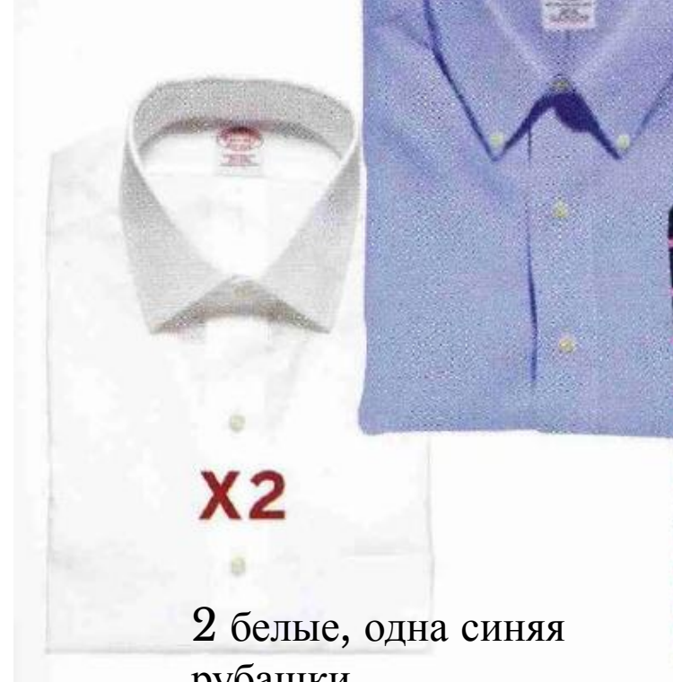
2 белые, одна синяя рубашки,