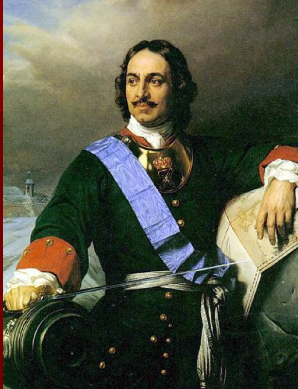
Царь Пётр I