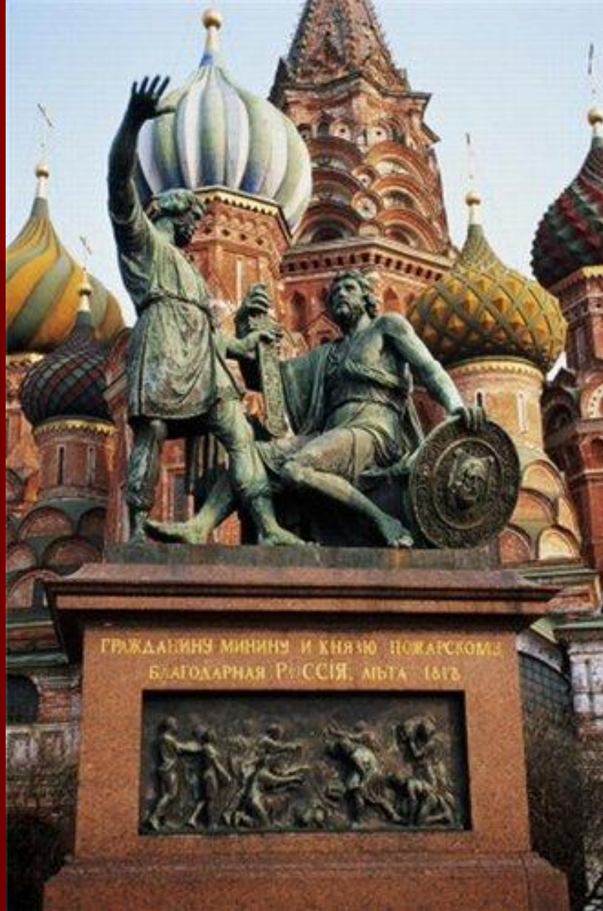
Храм Василия Блаженного и памятник Минину и Пожарскому