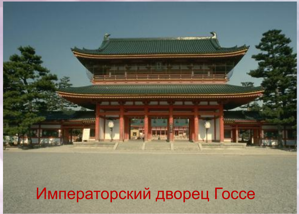
Императорский дворец Госсе