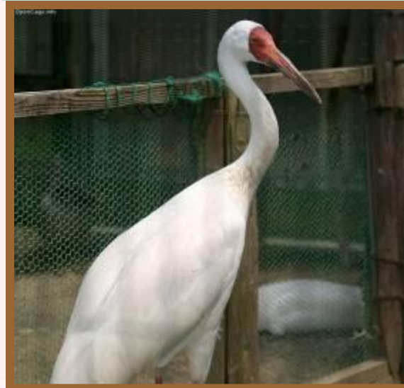
Белый журавль (стерх)