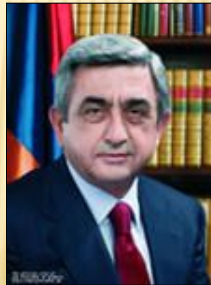
Серж Азатович Саргсян