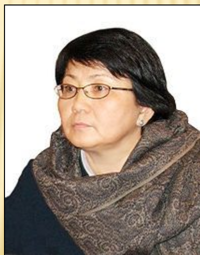
Роза Исаковна Отунбаева