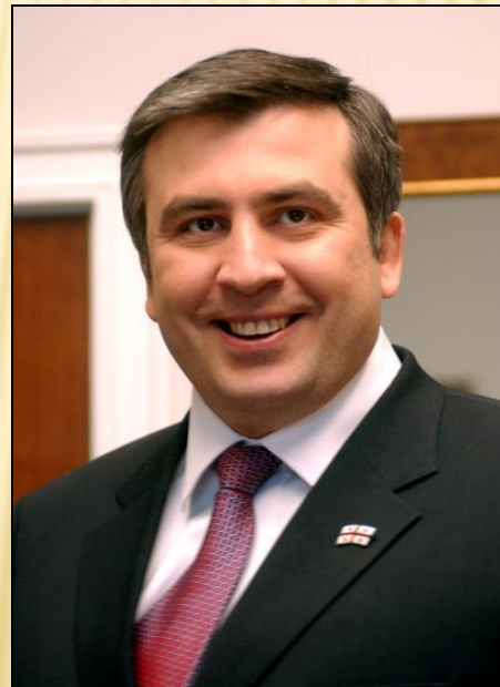
Михаил Николозович Саакашвили