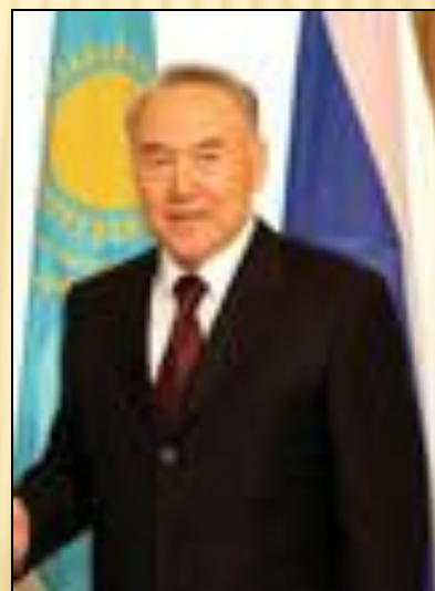
Нурсултан Абишевич Назарбаев