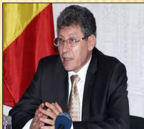
И.о. президента Михай Гимпу