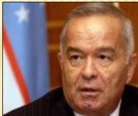
Ислам Абдуганиевич Каримов