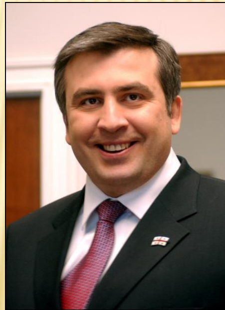
Михаил Николозович Саакашвили