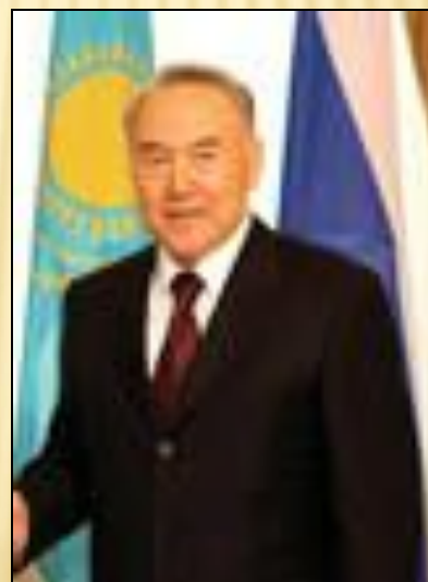
Нурсултан Абишевич Назарбаев