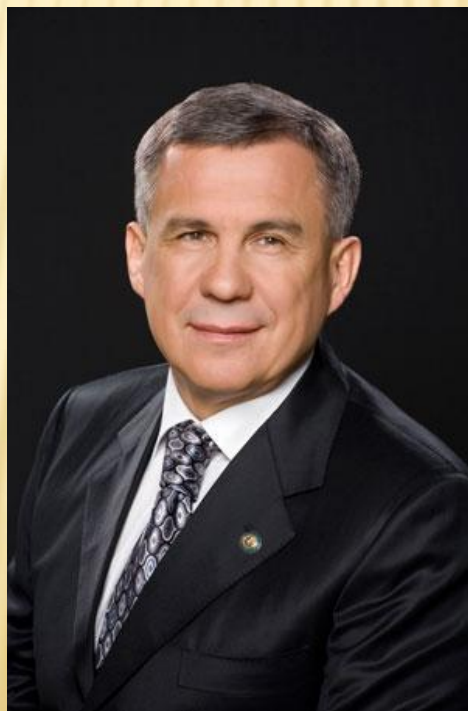
Рустам Нургалиевич Минниханов