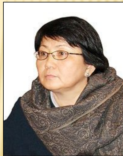
Роза Исаковна Отунбаева