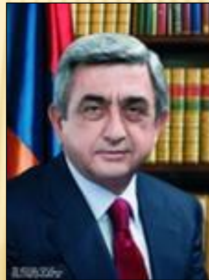
Серж Азатович Саргсян