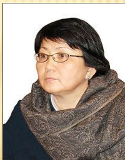
Роза Исаковна Отунбаева