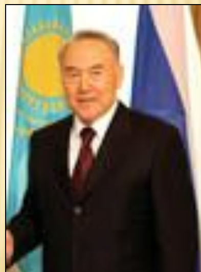
Нурсултан Абишевич Назарбаев