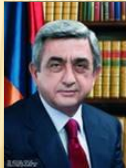
Серж Азатович Саргсян