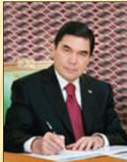
Гурбангулы Мяликгулыевич Бердымухамедов