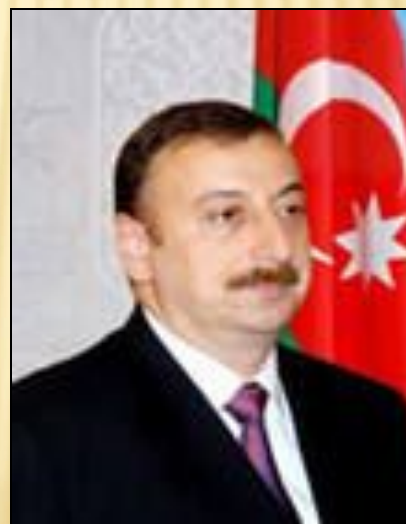
Ильхам Гейдар оглы Алиев