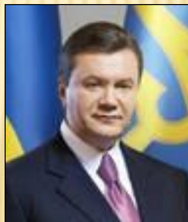
Виктор Федорович Янукович