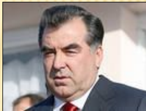
Эмомали Шарипович Рахмонов