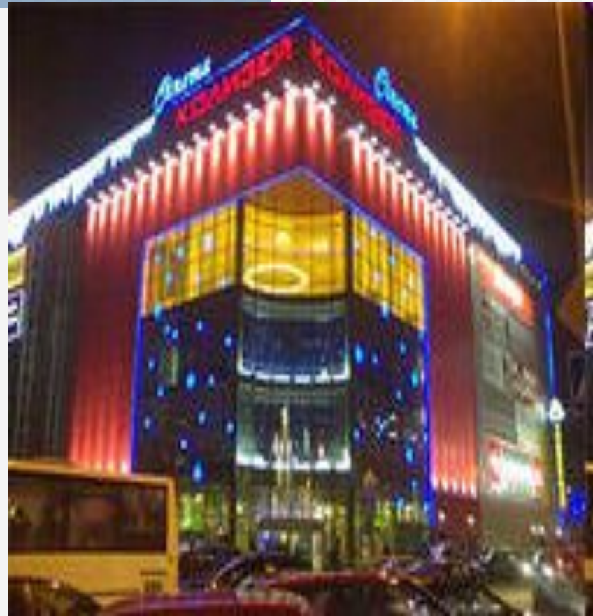
Коллизей - Синема

в доме, принадлежавший А.Е. Полевой находился мясной магазин № 45. Потом на этом месте долгие годы был неприглядный долгострой. Что сейчас на этом месте?