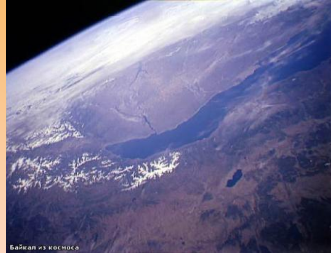
Байкал из космоса