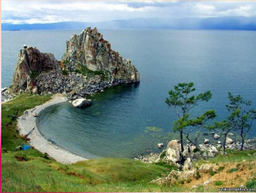
остров Ольхон на Байкале