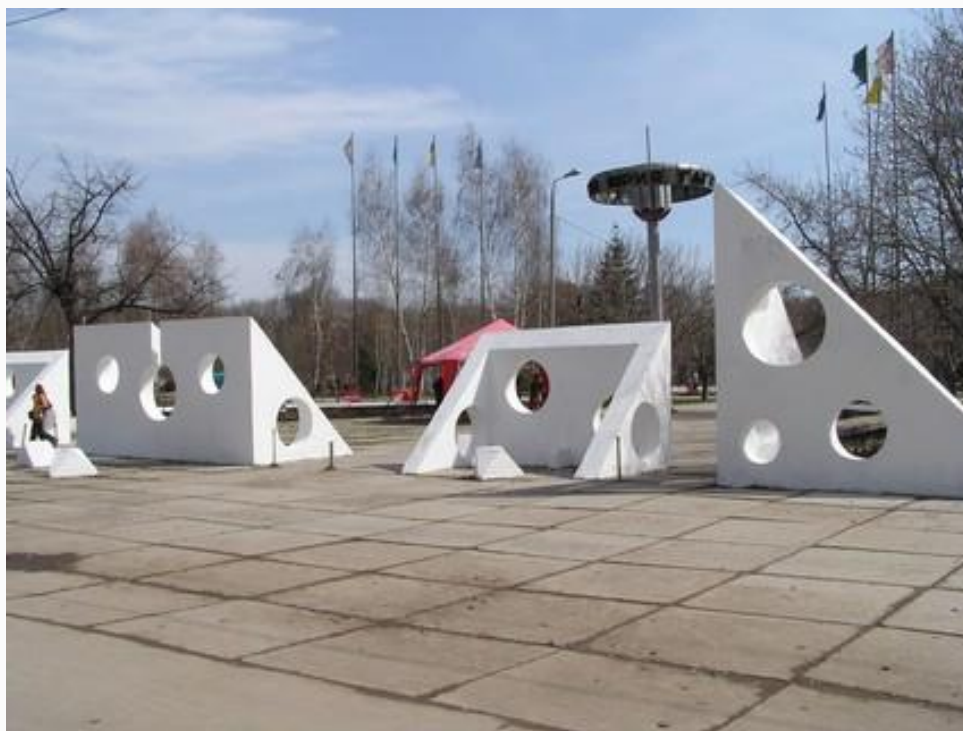
Парк им. Ю. Гагарина в Самаре

Во многих городах России и в городах других стран существуют улицы названные именем космонавта, проспекты, площади, бульвары, парки, клубы и школы имени Гагарина.