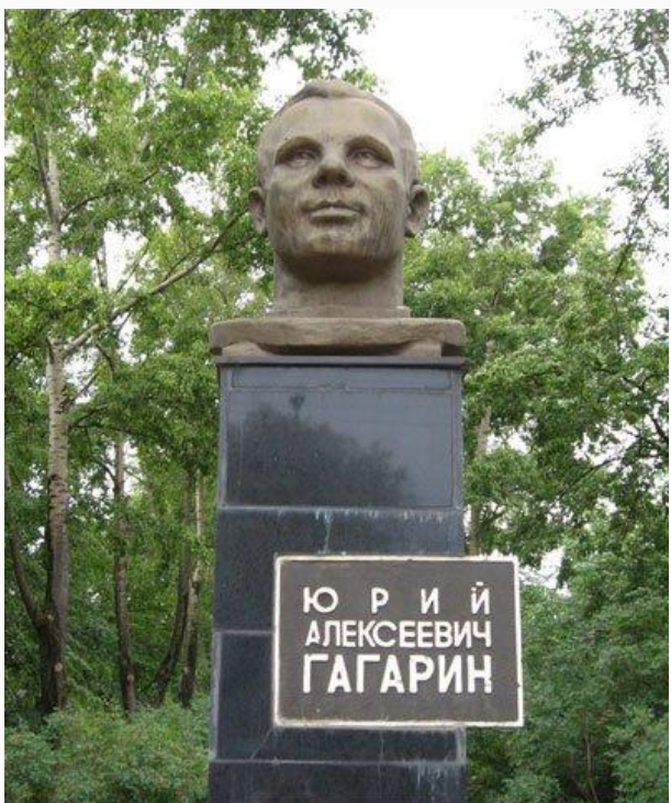
Памятник Ю. Гагарину в Москве