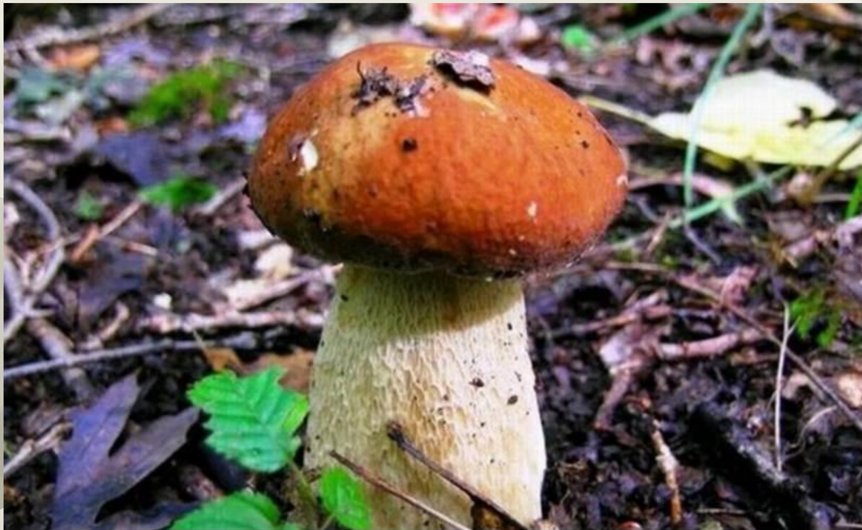
Боровик (белый гриб)