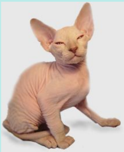
петербургский сфинкс (или петерболд)