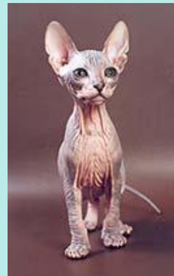
донской сфинкс (или донской лысак)