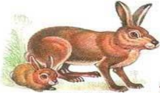
заяц с зайчонком