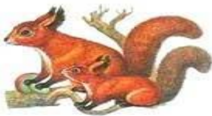
белка с белочком