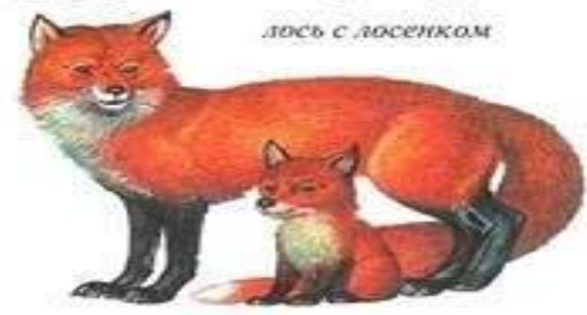
лиса с лисенком