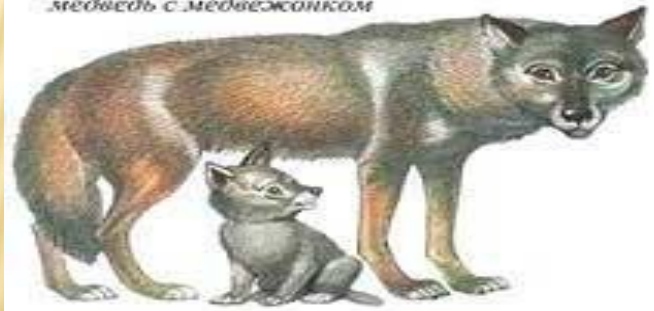
волк с волчонком