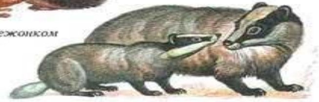
барсук с барсучонком