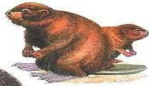
бобр с бобренком