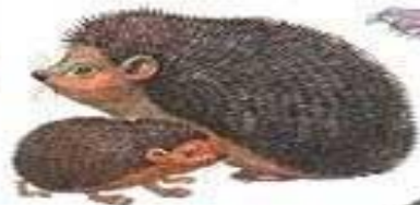
еж с ежонком