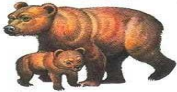
медведь с медвежонком