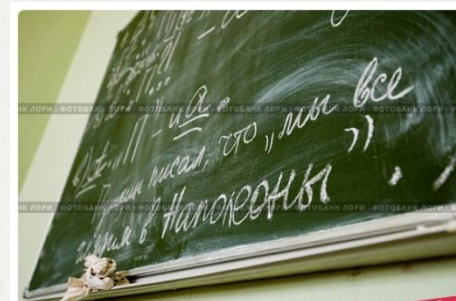
Школьная доска