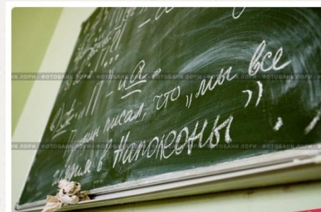
Школьная доска