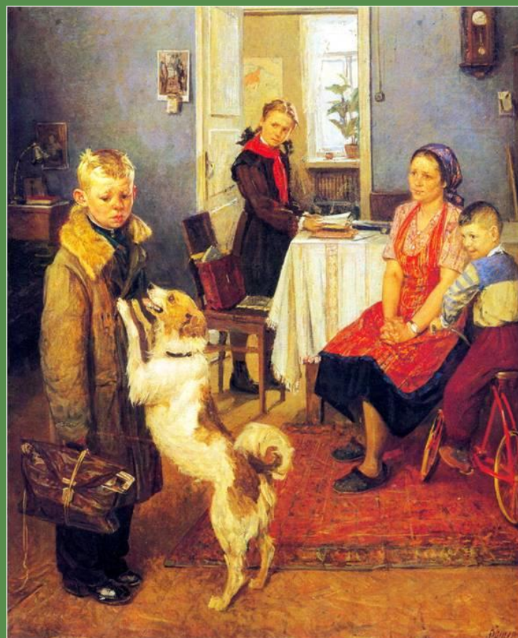
Ф.П. Решетников «Опять двойка» 1952 г