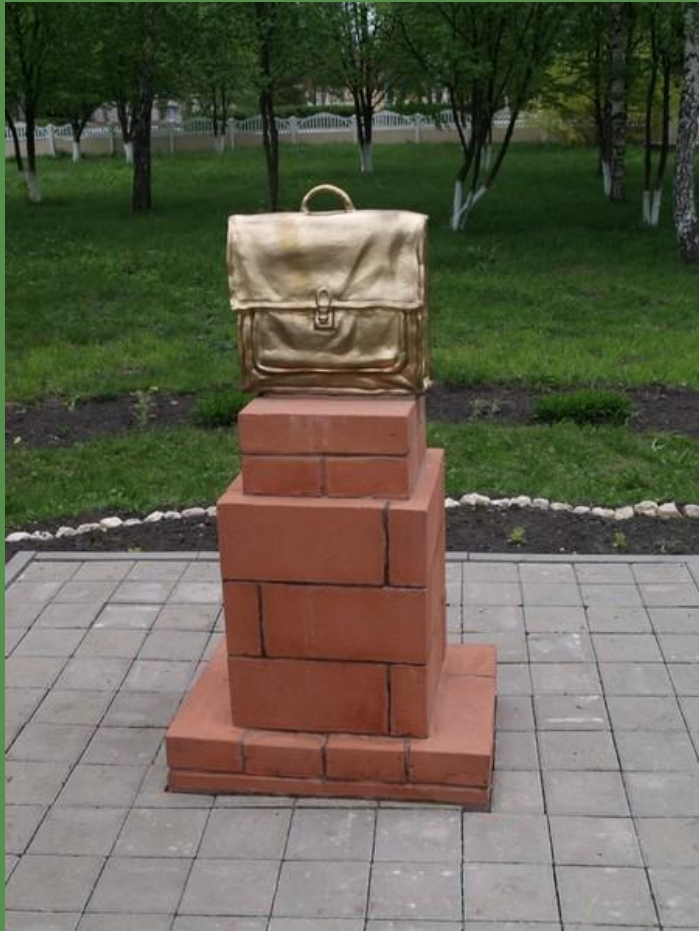
Венгеровская средняя школа в Белгородской области Автор скульптурной композиции А.Н. Беликов

Памятник простому школьному портфелю установлен в Белгородской области