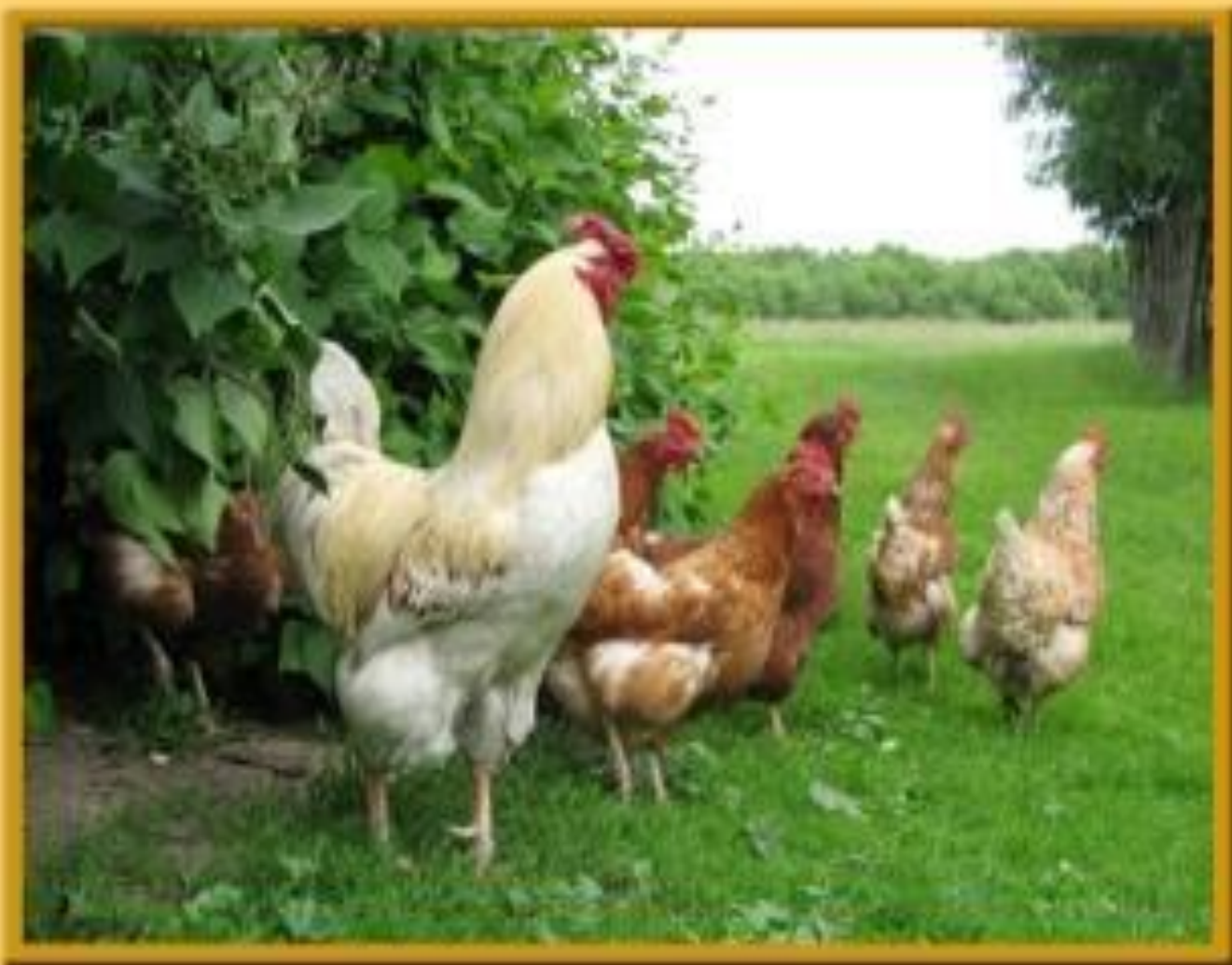
Петушок с семьей