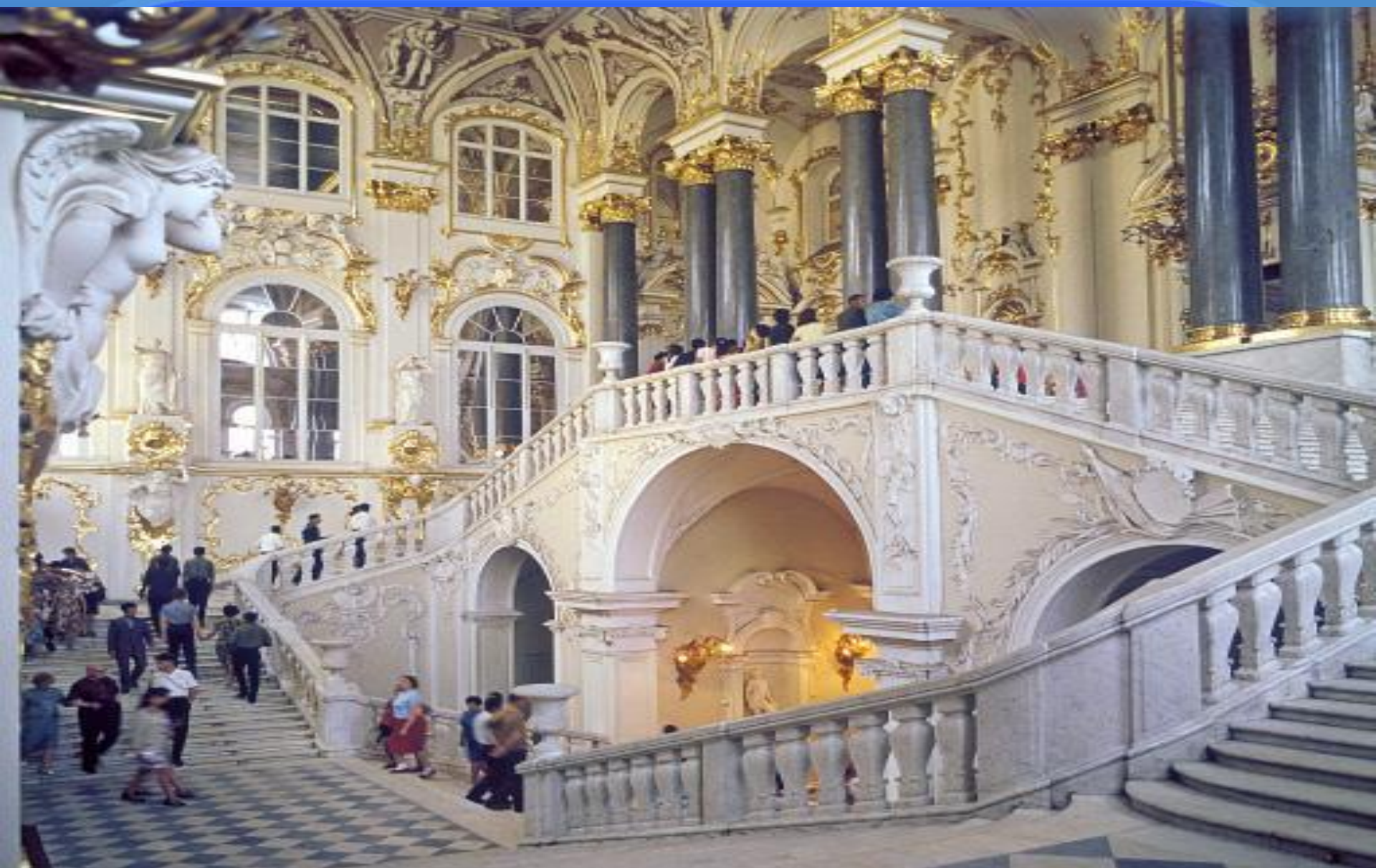
Парадная лестница Зимнего дворца.