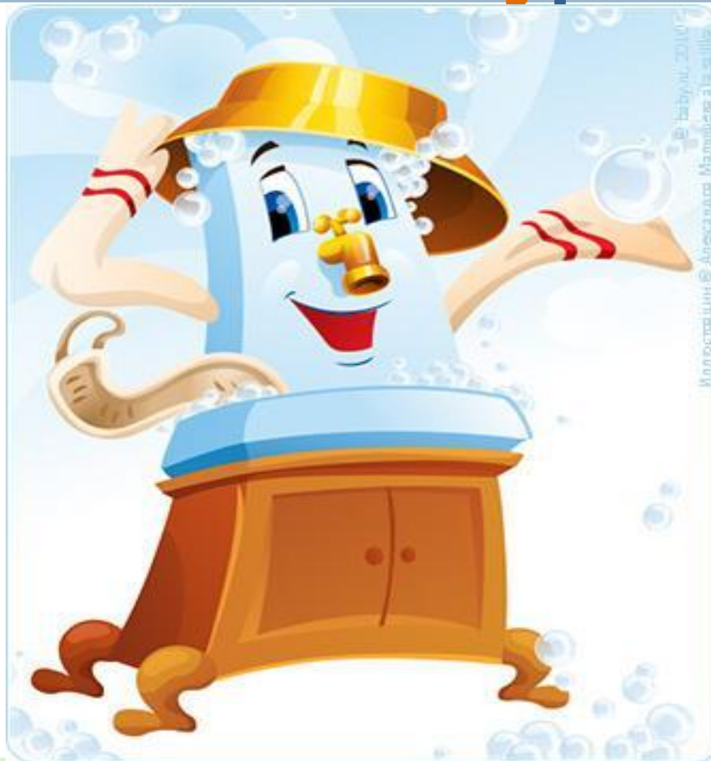
Иллюстрация: В. Алесандров. Мультфильм: «Водопроводчик»