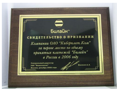
«Билайн»: первое место про объему принятых платежей» за 2006 г.

В декабре 2006 г. преодолен порог 3 млн. платежей в день.