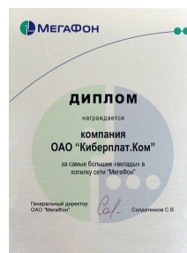
Диплом «Мегафон» за самый большой вклад в «копилку», 2005 г.