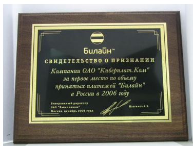
«Билайн»: первое место про объему принятых платежей» за 2006 г.

В декабре 2006 г. преодолен порог 3 млн. платежей в день.