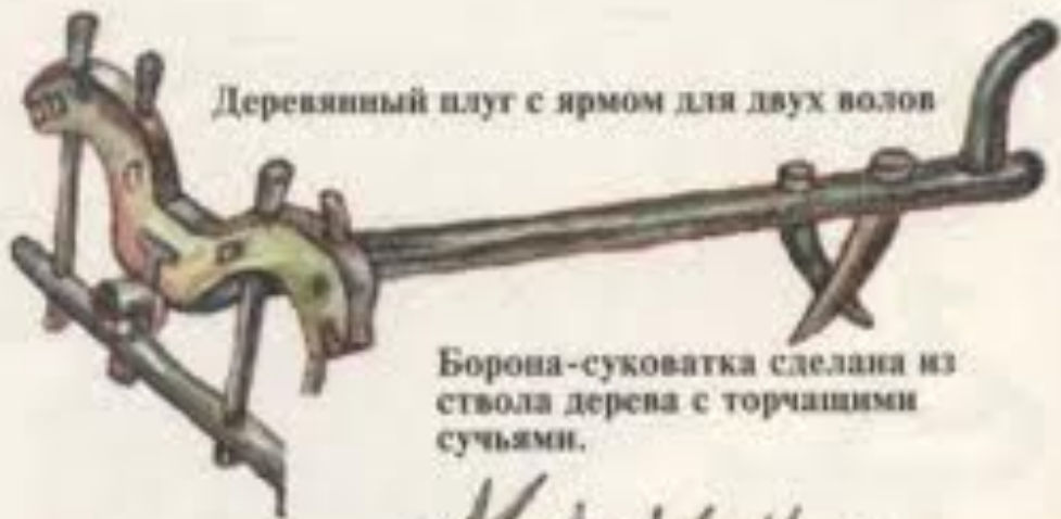
Деревянный плуг с ярмом для двух волов

Борона-суковатка сделана из ствола дерева с торчащими сучьями.