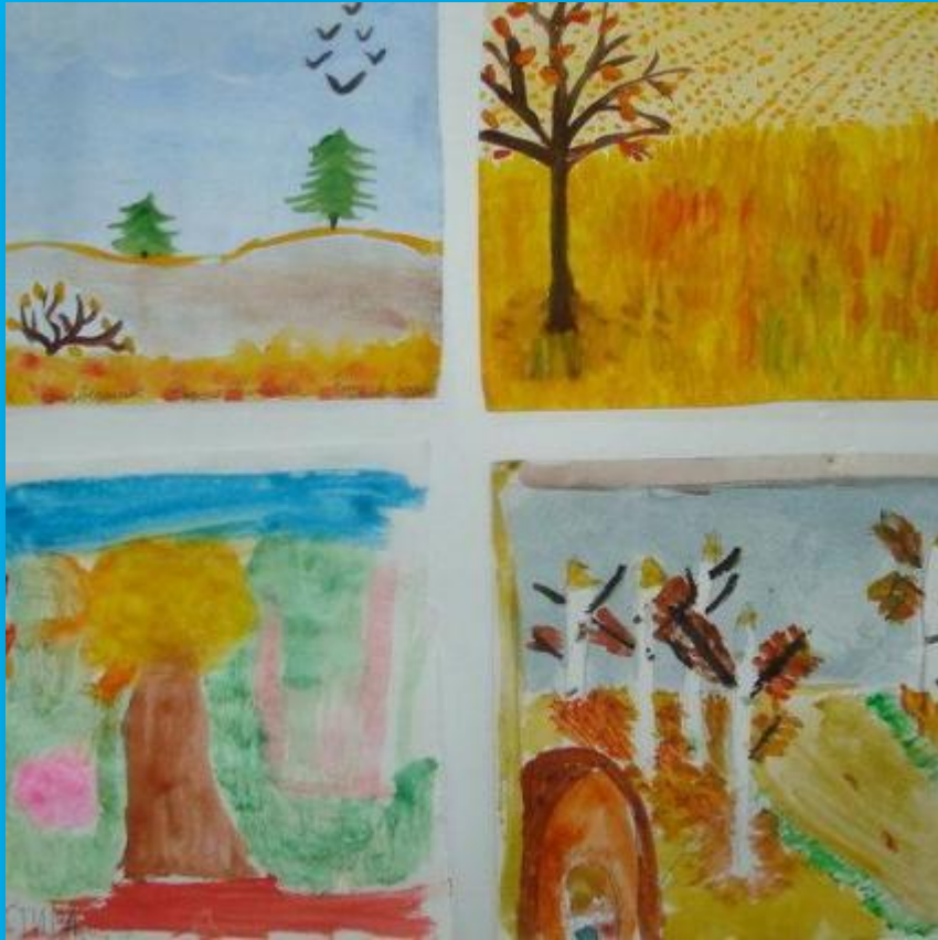
« Природа родного края»