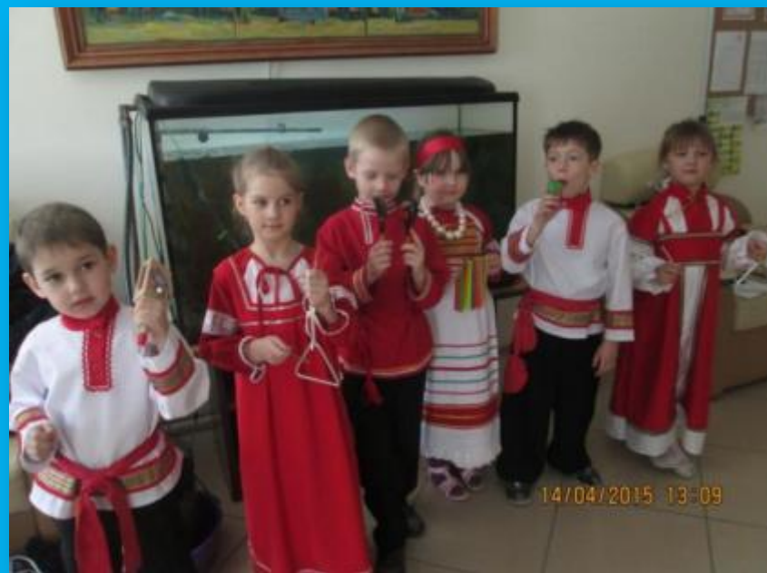
Участие в конкурсе Православной гимназии