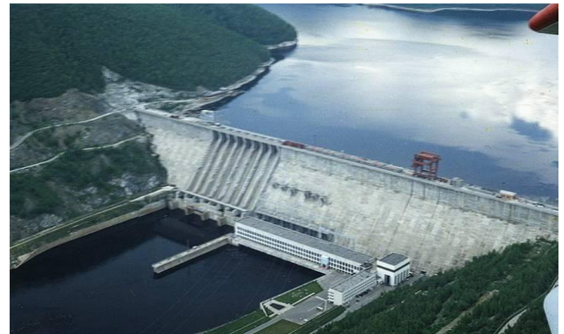
С помощью воды человек добывает электроэнергию