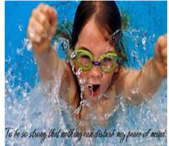
To be so strong that nothing can disturb my peace of mind. Источник наслаждения