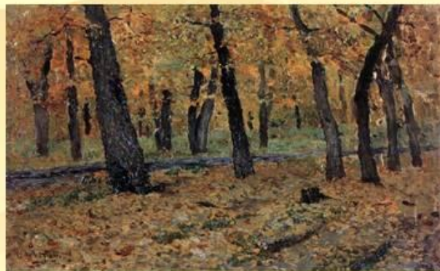
«Дубовая роща. Осень»