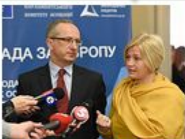
РАДА ЗА ЄВРОПУ