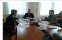
Засідання робочих груп