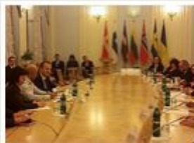
Зустріч з делегацією голів парламентів держав Північної Європи та Балтії